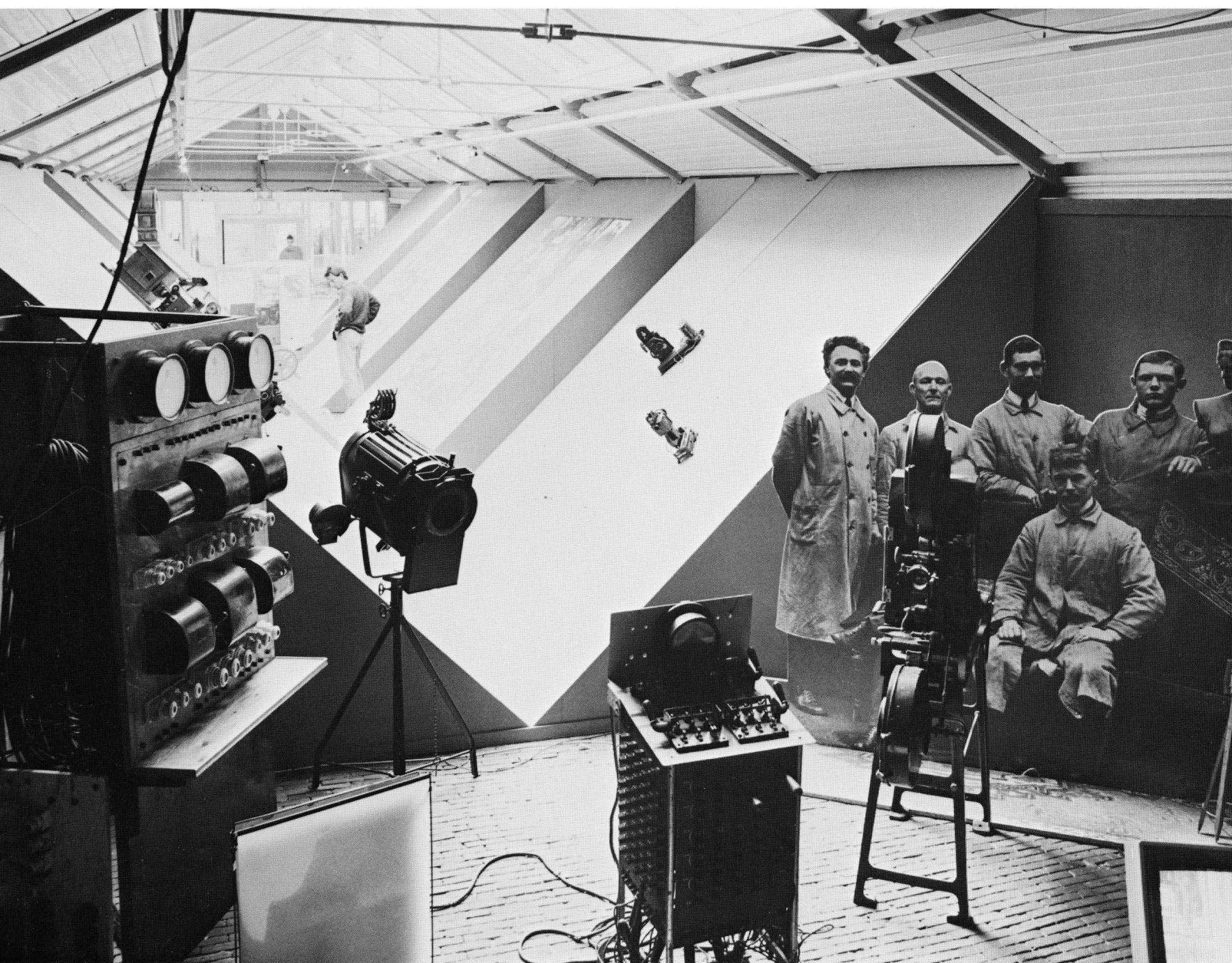
Tentoonstelling 'Hollywood in Holland'

frans halsprijs voor tentoonstellingsvormgeving