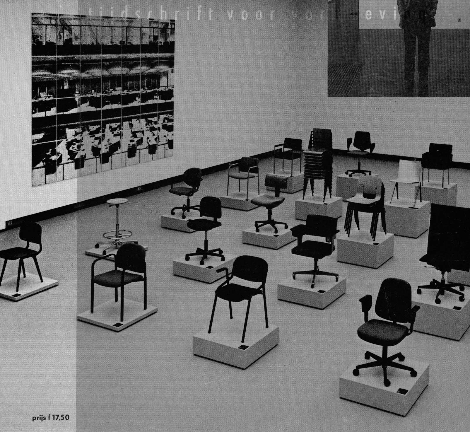
prijs f 17,50