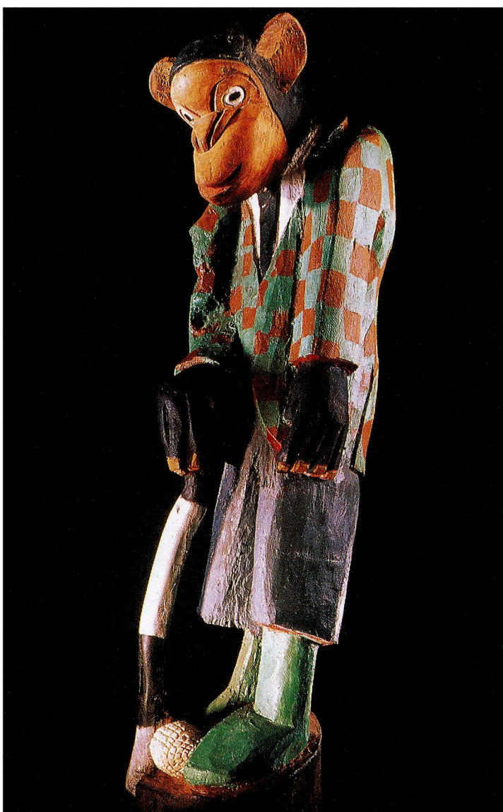
Owen Ndou, 'Sport for a gentleman', 1992. Hout, h. 190 cm. Ndou: 'Het is geen aap, geen zwarte, geen blanke, alleen maar een man. Het is een moeilijke sport, golf, niet voor iedereen.'

INCLUSIEF NEDERLANDSE TENTOONSTELLINGSAGENDA / MET MEER DAN 1000 EXPOSITIES