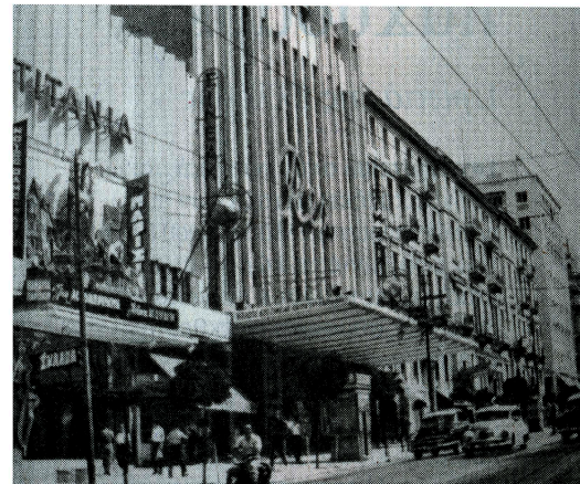
Το «Ρεξ» και το «Τιτάνια» επί της οδού Πανεπιστημίου στα τέλη της δεκαετίας του '50.