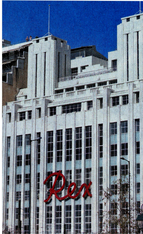
Το κτίριο του «Ρεξ» στην οδό Πανεπιστημίου κλείνει φέτος 80 έτη ζωής.

Έργο του αρχιτεκτονικού διδύμου Βασίλη Κασσάνδρα και Λεωνίδα Μπόνη, που προ ετών είχαν συνεργαστεί για το συγκρότημα του Μετοχικού Ταμείου Στρατού, το «Ρεξ» ήταν κοσμογονία. Η απόγονος των αδελφών Σικιαρίδη, η αρχιτέκτων Ελισάβετ Σικιαρίδη που μελετά την οικογενειακή ιστορία, παρατηρεί πως «την απόφαση για